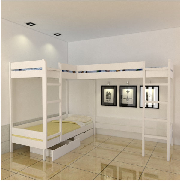
???? ???? ??????????

???????? ??????????????, ? ????????? ?????? ? c ????????? ??????, ?????????, ??? ?????? ?????? Second 2-LCH-CHU-D1-150 ??? ??? ?????????? ? ? ?????????????? ?? ????????? ?????? ( ?????? )