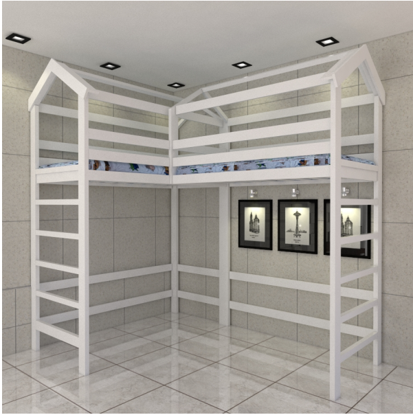
???? ???? ?????????

???????????????? ??????? ?????? ? ??????? ?????? ? c ??????? ??????, ????????, ? ???? ??????? Domik-CHUF-100W ??? ?????????? ? ?????? ?? ????????? ?????? ( ?????????? ??????? )