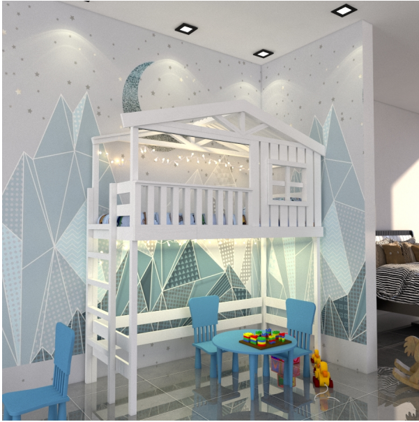
???? ???? ?????????

???????? ?????? ?????????????? ? ???? ?????? Chalet-CH-G1N-Lch ??? ?????? ? ??????????? ? ? ??????? ?????? ( ?????? )