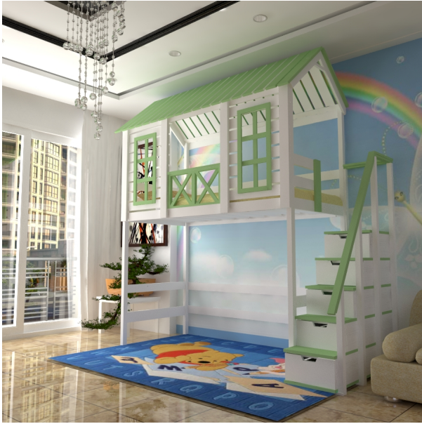
???? ?? ????????

??????? ?????? ?????????????? ? ??? ???? Barby-Ch-G2S-LKP4 ??????? ?????? ? ?????? ?????? ? c ?????? ?????, ?? ????? ? ?????????? ?? ?????? ??????