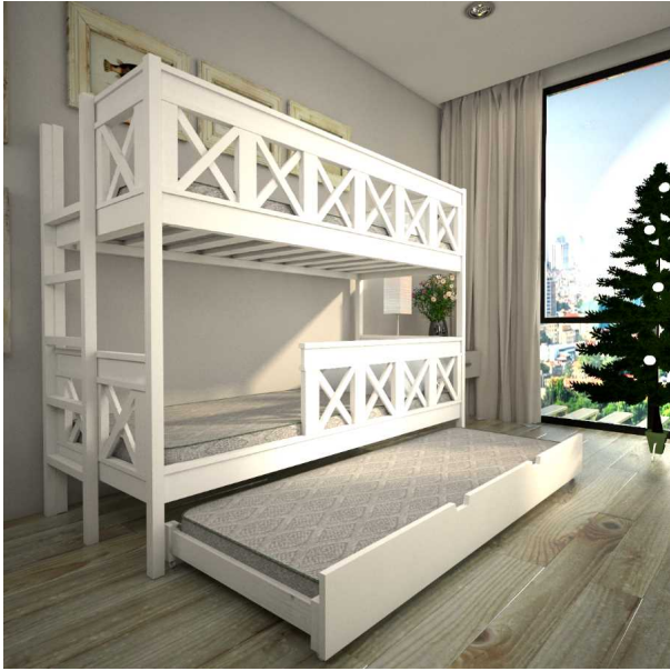
???? ???? ??????????

???????? ?????????????? "Shale-D2-2-LCh-BN-VK", ?????????????? ?? ???????? -????? ( ?????? ). ??? ?????? ? ??????????? ??????? ?? ????????? -2000??, ??????????? ?????? ????????? (?? ????? ?? ??????) 900??,