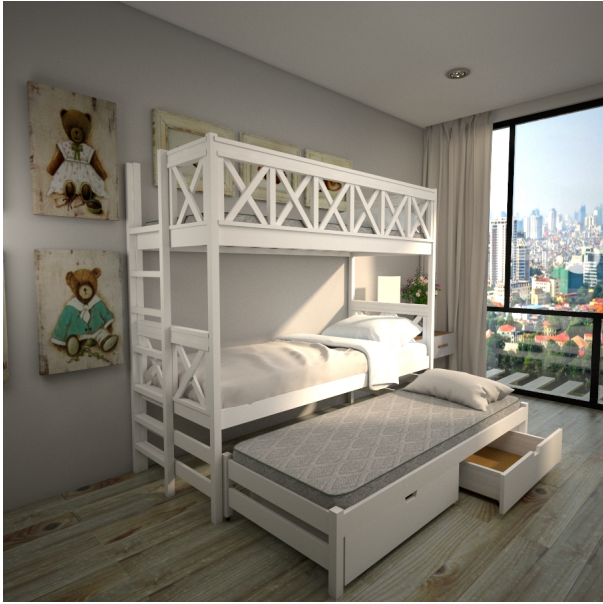
???? ???? ??????????

???????? ?????????????? "Shale D1-2-LCH-VKY, ?????????????? ?? ????????? ??????. ??? ?????? ? ?????????????? ????????? ?? ?????????? -2000??, ?????????????? ?????? ????????? (?? ?????? ?? ??????) 900??,