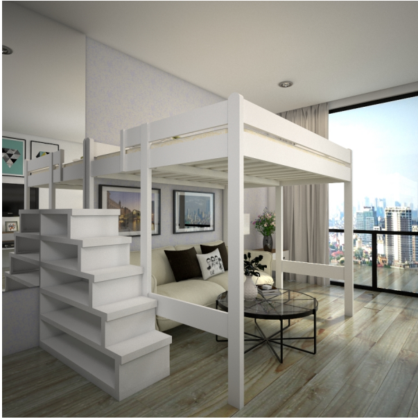
???? ??? ????????

???????? ?????? ? ??????? ?????? ? c ??????? ??????, ??????????? ??? ?????????? Second-CH2-LS-W-150 ?? ??????? ?????? ( ??????? )