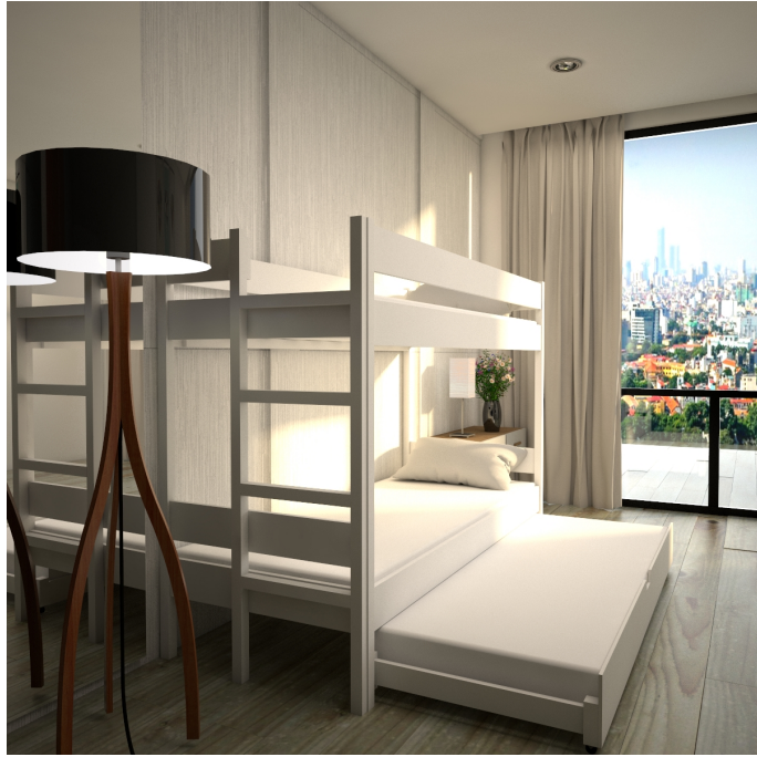
???? ???? ??????????

Second-2LT-150VK ?????????????? ??????????. ?????????????? ????????? ? ????. ?????????? ?????????? ?? ????????? ?????? ( ??????? )