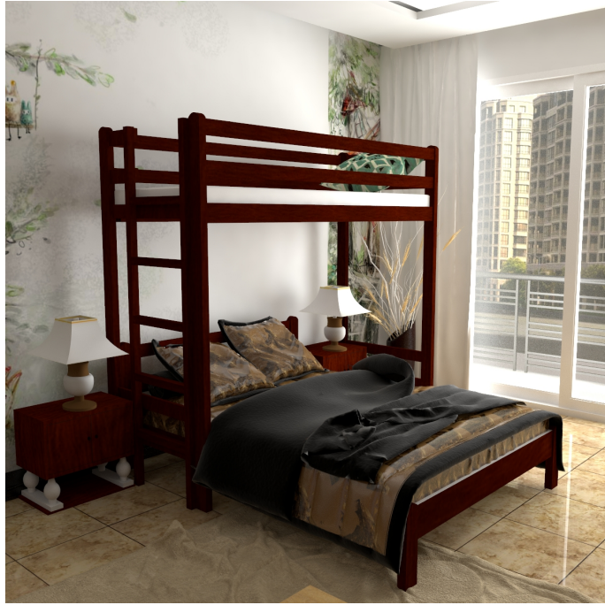
???? ??? ?????????

???????????????? ?????????????? ?????????? ?????????????? First 23LTr-W75 ??? ?????, ?????????? ? ????????????? ?? ????????? ?????? ( ?????? )