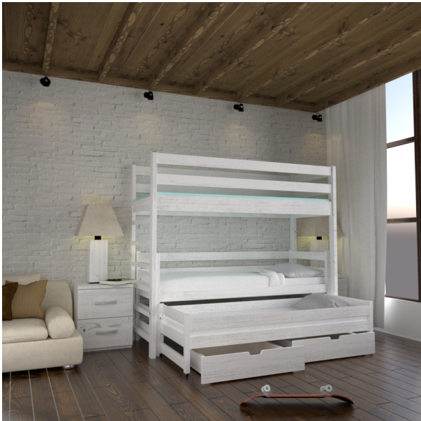
???? ???? ??????????

????????? ?????????????? Brigantina-23W-VKY ?????????????? ?? ?????????? -????? ( ?????? ). ??? ?????? ? ?????????????? ?????????? ?? ?????????? -2000??, ?????????????? ?????? ?????????? (?? ?????? ?? ??????) 900??,