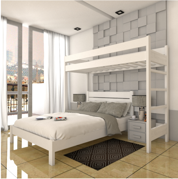
???? ???? ??????????

????????????? ?????????????? ?????????? ?????????????? Brig- 23-W-150 ??? ?????, ?????????? ? ?????????????? ?? ????????? ??????